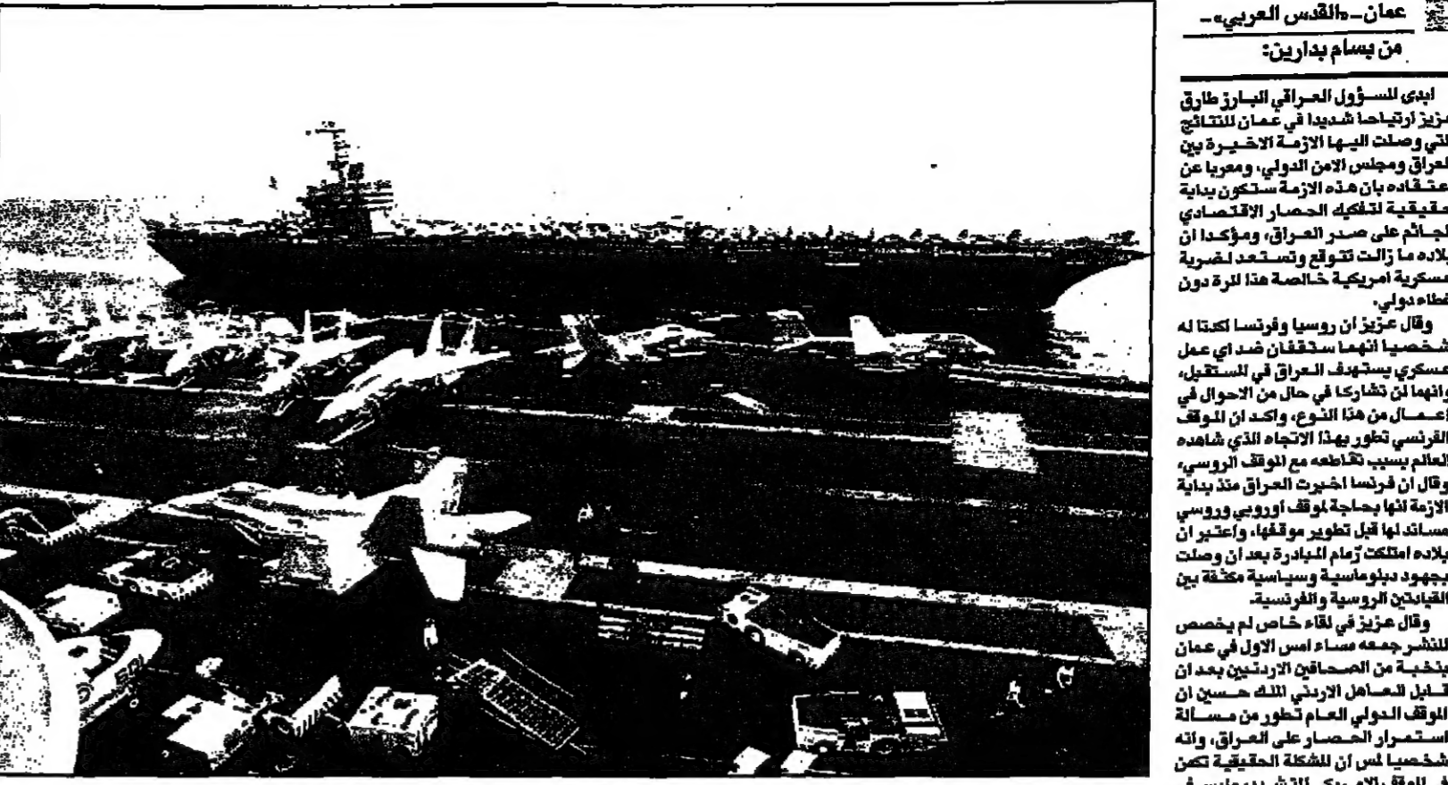
حاملة الطائرات الأمريكية جورج واشنطن ودميترية، متجاورتان في الخليج